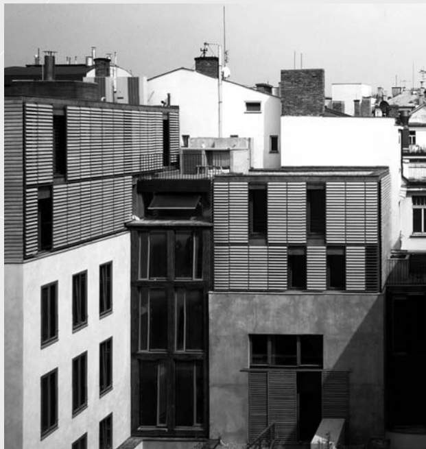
Ladislav Lábus: Langhans