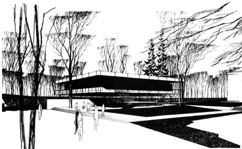
Miroslav Masák: návrh pavilonu F v Liberci

veň by umožnilo i její širší využití. S ohledem na význam stavby i lokality bychom považovali za správné, aby se využití této stavby i její obnovy a obnovy souvisejících zahrad jakožto prostoru veřejného ujalo město a umožnilo tak dotvořit součtveří pozemků utvářejících celek této lokality.