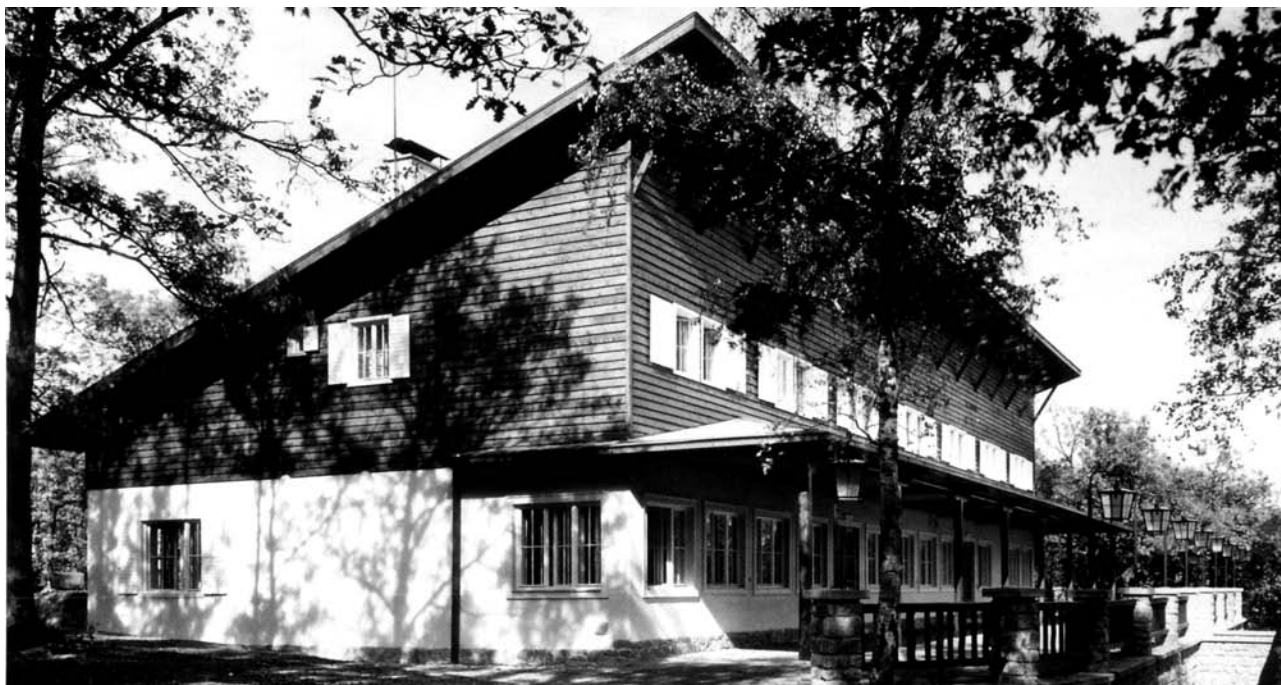
B. Tureček: Výletní restaurace Myslivna v Brně (1938–1939)