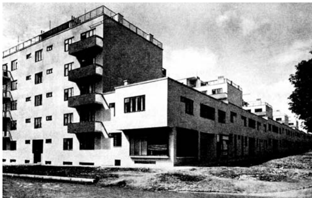
J. Polášek: Soubor nájemných domů v Brně (1931–1932)

Přes krátký život předlouhá řada projektů a desítky realizací v mnoha stavebních druzích, z nichž převládají stavby obytné a školské, lokalizované hlavně na Moravě, zejména v Brně a v Kyjově včetně okolí. Rovněž praxe urbanistická a bohatá činnost teoretická, publicistická i organizační s tahem na bydlení, a to zvláště standardní a sociální.