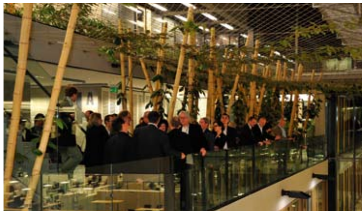
Prezentace udržitelné architektury v soukromém sektoru – budova ústředí ČSOB