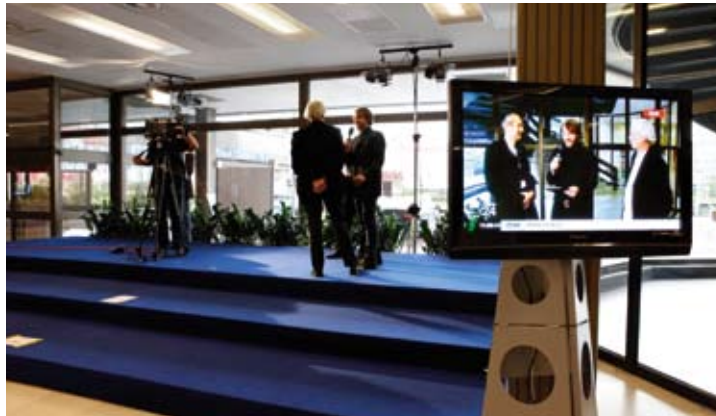
Přímý vstup do vysílání České televize

Dokument nazvaný Politika architektury je schválen již v řadě evropských zemí a právě vzdělávání a výchova týkající se architektury jsou vždy jeho hlavní součástí. Dalším důležitým tématem politik architektury je obvykle oblast veřejných zakázek a třetím okruhem oblast obecné podpory architektonické kvality v městském a venkovském prostředí. Neformální síť EFAP, která vznikla v roce 2000, sdružuje většinu států Evropy a klade si za cíl právě podporu architektonické politiky, tedy již zmíněných dokumentů zaměřených na posílení městské a krajinné kvality a obecně kvality životního prostředí jak na národní, tak na evropské úrovni.