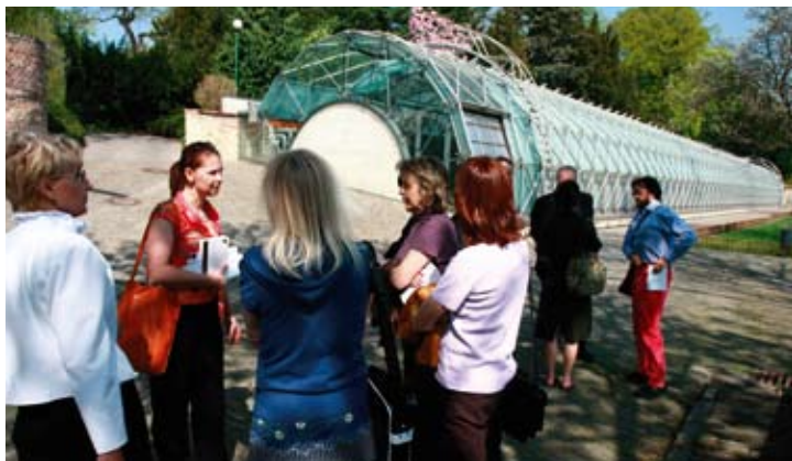
Exkurze po současné pražské architektuře