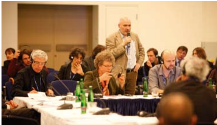
Každý blok jednání na konferenci byl zakončen diskusí