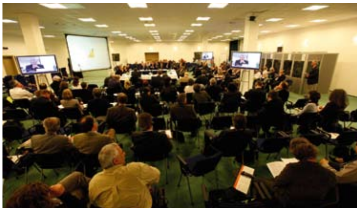
Zasedání v Kongresovém centru v Praze