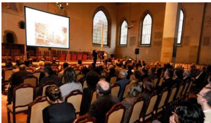
Praha – současnost a budoucnost, slavnostní večer v Betlémské kapi