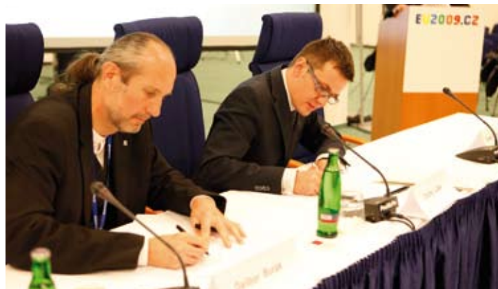
Předseda ČKA Dalibor Borák a ministr školství Ondřej Liška podepisují Memorandum o vzdělávání a architektuře

Ministerstvo školství, mládeže a tělovýchovy České republiky a Česká komora architektů vydávají při příležitosti pražské konference Evropského fóra politiky architektury EFAP 2009, organizované v rámci předsednictví České republiky v Evropské unii Českou komorou architektů a Ministerstvem pro místní rozvoj, společně