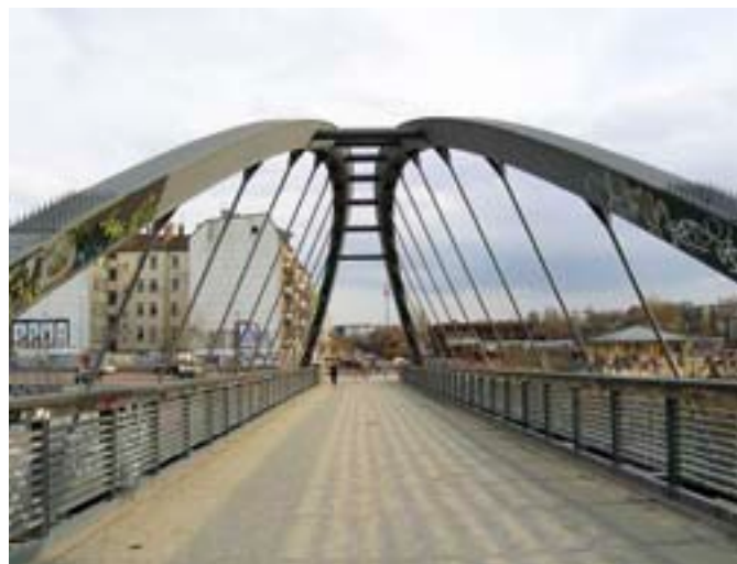
Most Schwedter Steg, Berlín / Axel Oestreich, 1999, foto wikipedia.org.

Stavební kultura lze dosáhnout integrací těchto kvalit a dosažením rovnováhy mezi těmito různými kvalitami, nikoli pouze optimalizací jedné z nich.