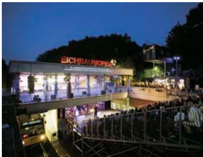
Oaktree Opera, Mülheim an der Ruhr / RaumlaborBerlin, Jan Liesegang, Matthias Rick, 2011

Veřejná prostranství – je nezbytně nutné pozorně sledovat změny, které probíhají na veřejných prostranstvích. Ačkoliv má stát ústavní povinnost zajistit rovné životní podmínky pro všechny své občany,