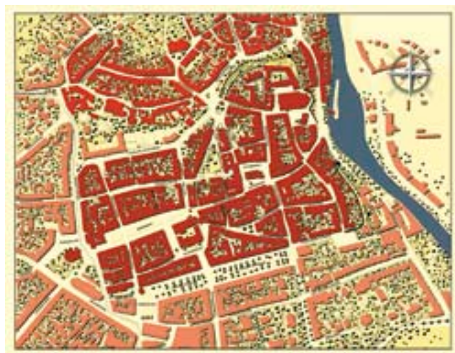
Historické centrum města Görlitz považují Němci za příklad města s vysokou architektonickou hodnotou.