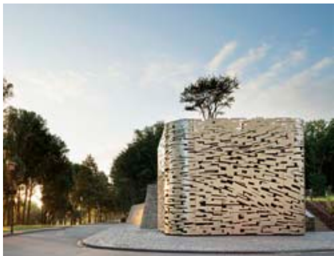
Čerpací stanice Cologne-Rodenkirchen / Dirk Melzer Landschaftsarchitekt & Umweltingenieur, 2011

Zpráva také shrnuje situaci politik architektury v Rakousku, Švýcarsku, Švédsku, Nizozemsku, Francii a Finsku. Z této analýzy jednotlivých zemí vyplývají tři společné jmenovatele: