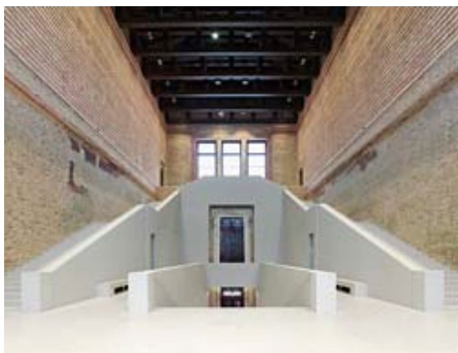
Nové muzeum v Berlíně, rekonstrukce / David Chipperfield, 2011