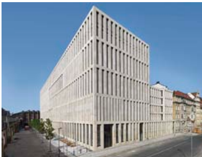
Nová ústřední knihovna Humboldtovy univerzity v Berlíně / Max Dudler, 2011