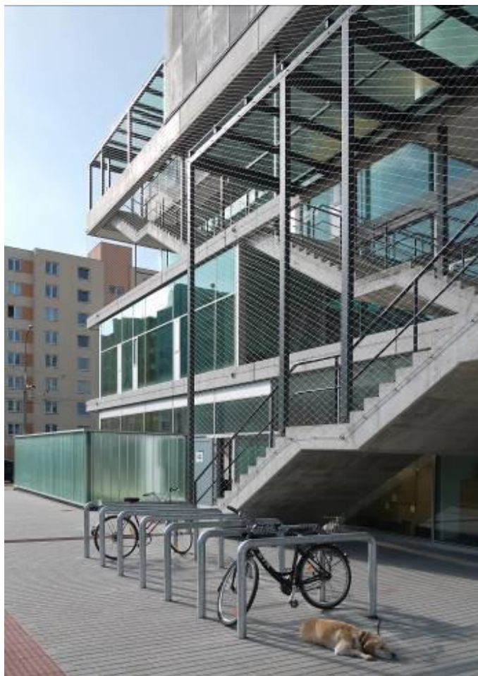
Komunitní centrum Máj, České Budějovice