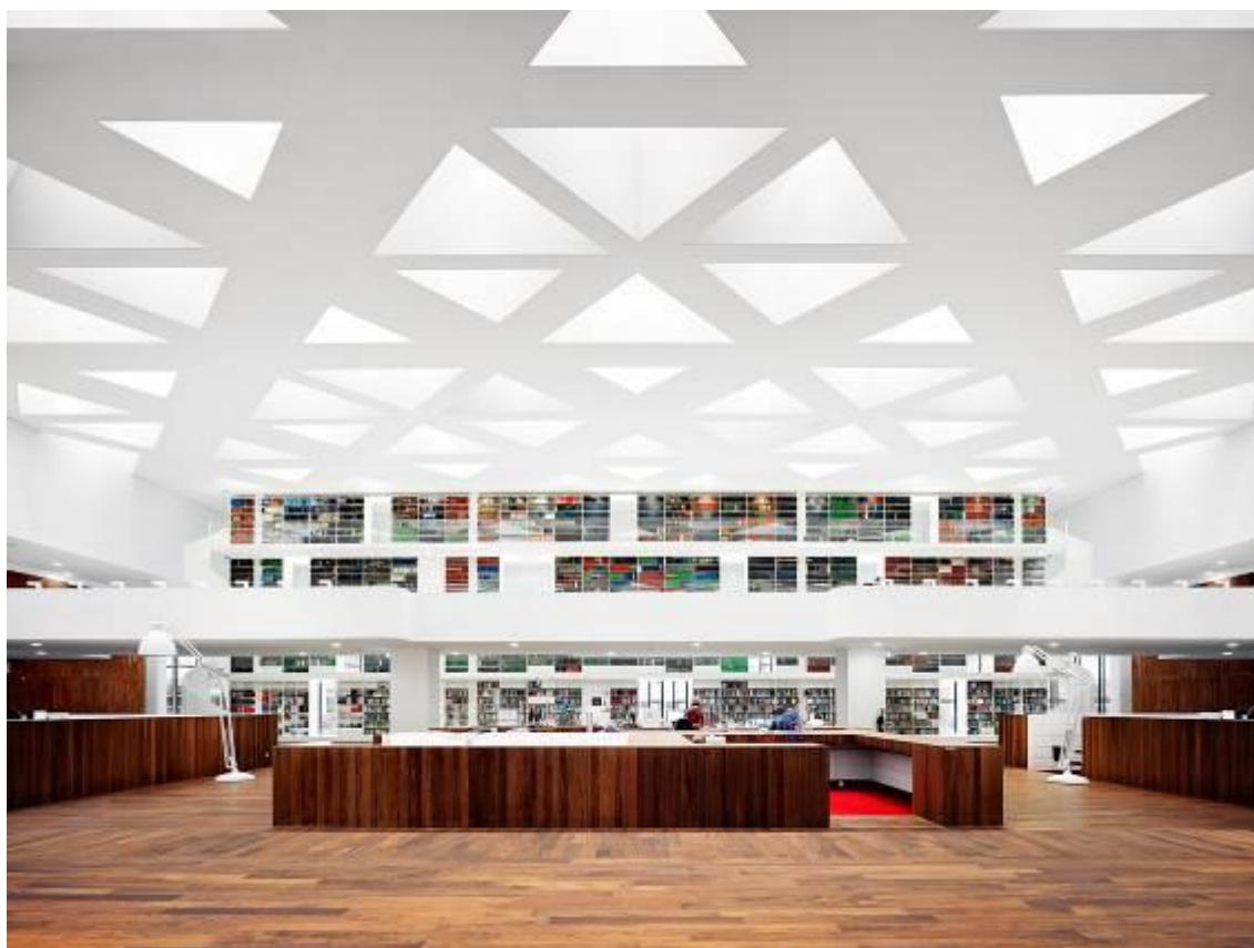
Vzdělávací centrum Erasmus, Rotterdam