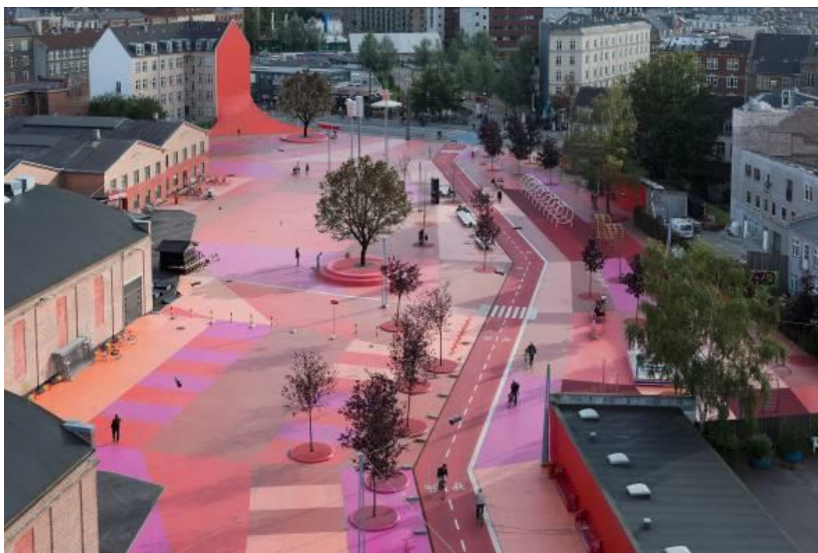
Náměstí Superkilen, Kodaň

2013 . Unikátní je rovněž revitalizace okolí památky z okruhu UNESCO - kláštera Lorsch , která získala Cenu německé krajinářské architektury za rok 2015 . Českému publiku byla práce Martina Rein-Cana představena v roce 2012 na konferenci reSITE.