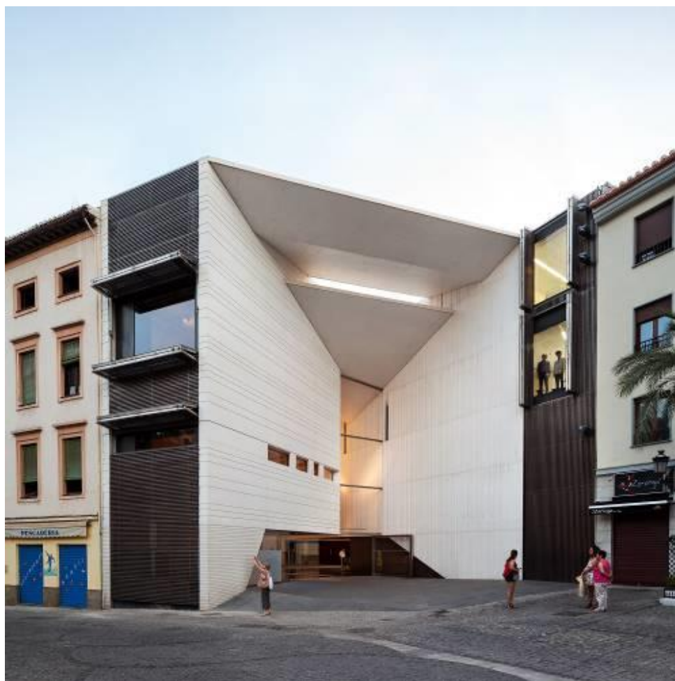
Kulturní centrum Federica Garcíi Lorcy, Granada

na rozvoj architektonických soutěží či na urbanistickou koncepci v historických centrech měst. Kreativita a přínos ateliéru byly mnohokrát oceněny národními i mezinárodními cenami. Za muzeum Gösta Pavilion Serlachius ve Finsku bylo studio nominováno na Mies van der Rohe Award – Evropskou cenu za architekturu 2015 , dále získalo ocenění Arquitectura Española Internacional či finské ocenění za Nejlepší projekt ze dřeva v roce 2014 apod. Povšimnutí veřejnosti nezůstala skryta ani další unikátní realizace ateliéru MX_SI – Dětské muzeum Iztapalapa Papalote v Mexico City vzešlá jak jinak, než na základě architektonické soutěže.