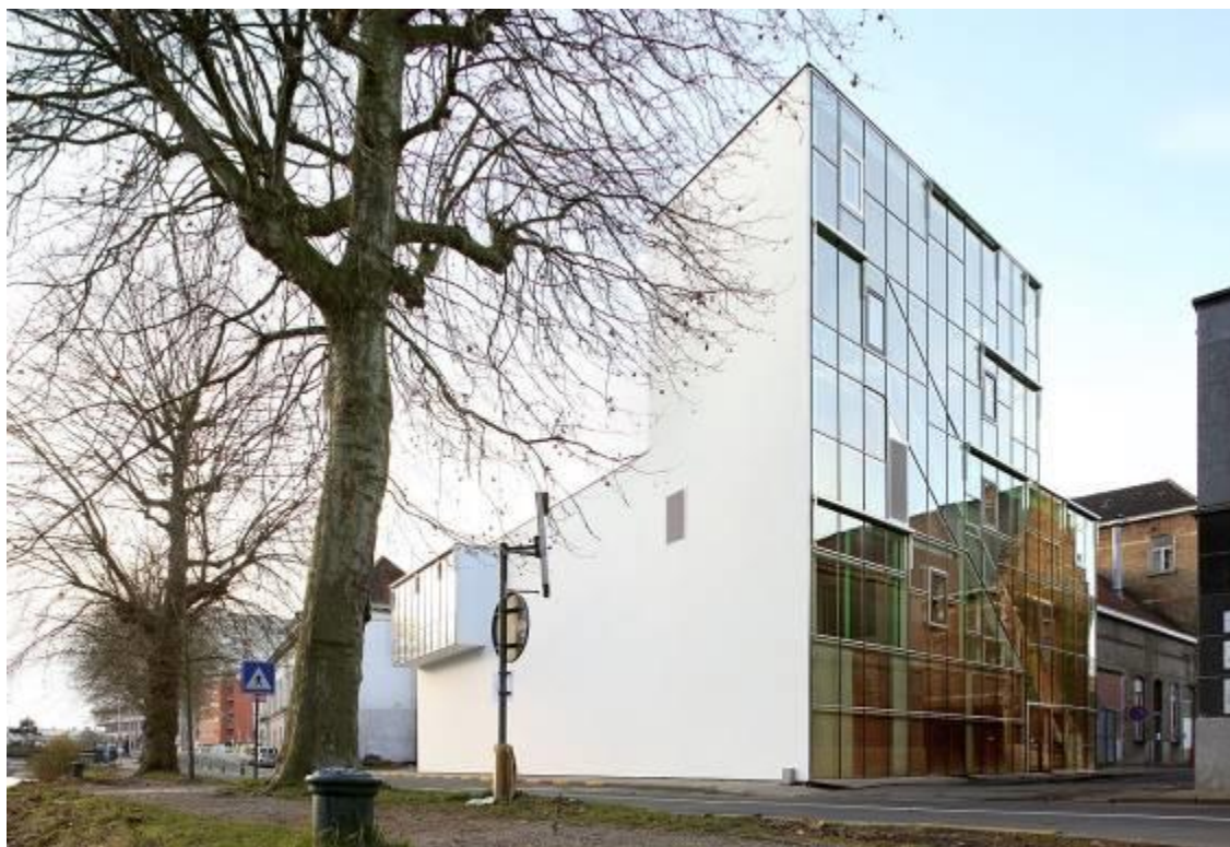
Les Ballets C de la B & Lod